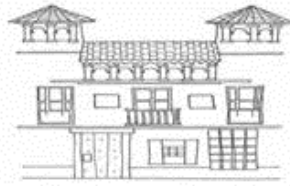
PALACIO DE LOS NAVAS S.XVI

Nuestros clientes pueden circular por calle Recogidas y calle San Matías, debe darnos su matrícula a la llegada al hotel para que autoricemos el vehículo, no nos la de antes. NO tienen derecho de paso por calle Reyes Católicos, calle Gran Vía de Colón u otras calles de acceso restringido.